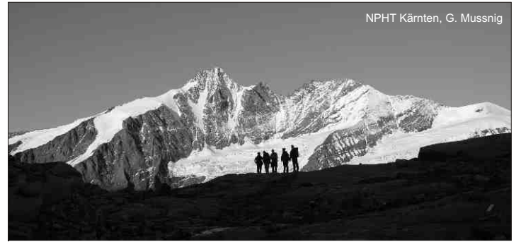
NPHT Kärnten, G. Mussnig

Zahlreiche Projekte rund um die Namenforschung versuchen genau das zu verhindern. Interdisziplinäre Forscherteams aber auch vermehrt Laienforscher befassen sich mit diesem Thema, engagierte Schulen widmen den Sprachdenkmälern der Vergangenheit viel Aufmerksamkeit. So geschehen in der Nationalpark-Hauptschule Winklern: parallel zu einem interdisziplinären Forschungsprojekt wurde hier erstmals ein „Flurnamenprojekt im Unterricht“ umgesetzt.