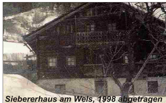
Siebererhaus am Wels, 1998 abgetragen

selbständigung der Altgemeinde Mörttschach. Für die Wiederrichtung der Gemeinde Mörttschach wird ein „Personenkomitee“ gegründet. Mit 31.12.